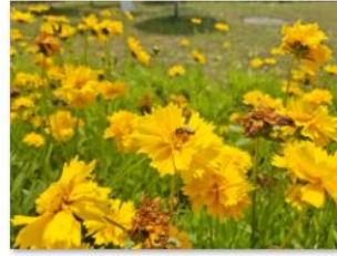
2019 级护理学 王大云