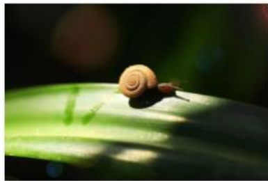
2020 级药学研究生 张开弦